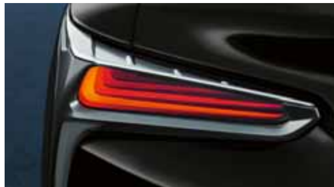
01 A hátsó lámpa 'L' formájú fénye a Lexus jellegzetessége 02 Az LC 500h modellt a Multi Stage hibrid rendszer hajtja 03 Vezetőközpontú, luxuskivitelű belső tér 04 LFA-stílusú cockpit - belső tér